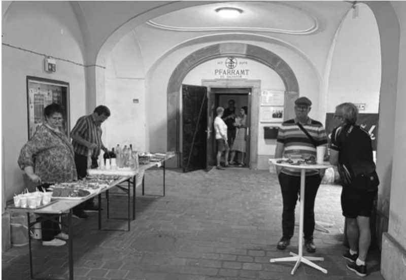
Die Helfer warten schon