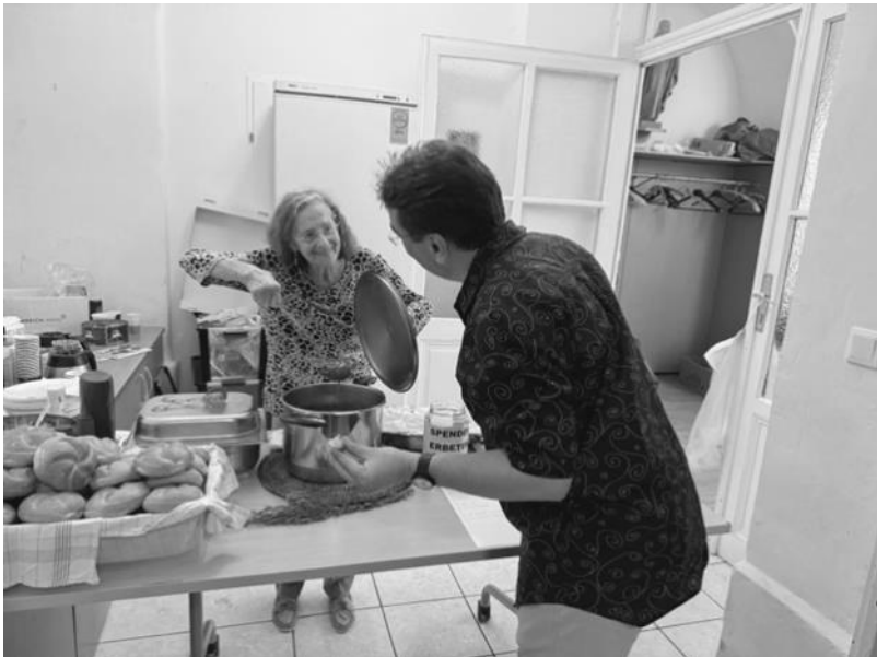
Die Stimmung ist auch hinter den Kulissen gut