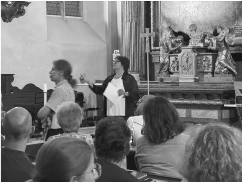
Volles Haus, volles Interesse